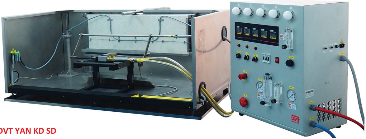
DVT YAN KD SD

KABLOLAR İÇİN YANGINA KARŞI DAYANIKLILIK TEST CİHAZI